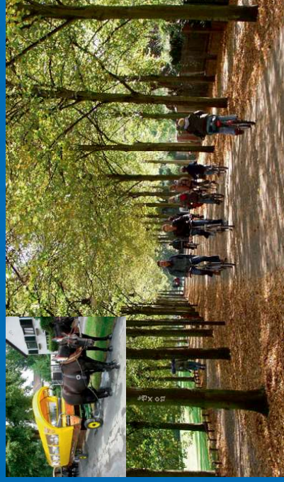
Planwagenfahrt oder geführte Radwanderung

Ev. Kirchengemeinde Großen-Linden Frankfurter Str. 42