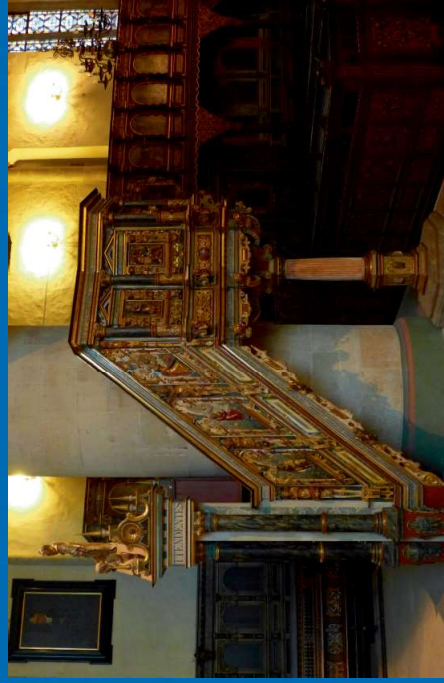
Spirituelle Impulse und Hintergrundinformationen zur "anderen Reformation" in Münster