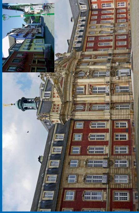
Stadtrundfahrt oder -führung in Münster

Die Kirchengemeinde Großen-Linden möchte im Jahr der Reformation neben vielen Veranstaltungen rund um Martin Luther auch andere Aspekte der Reformation in den Blick nehmen. Deswegen laden wir zu einer Fahrt nach Münster ein. Neben spirituellen Aspekten wird auch Zeit für Gemeinschaft, Natur und Bewegung sein. Egal, ob mit Gehhilfe, Rollator oder Fahrrad, wir machen ein Programm, bei dem alle dabei sein können.